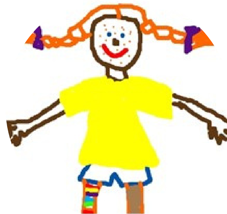
Bērnu centrs "Pepija"