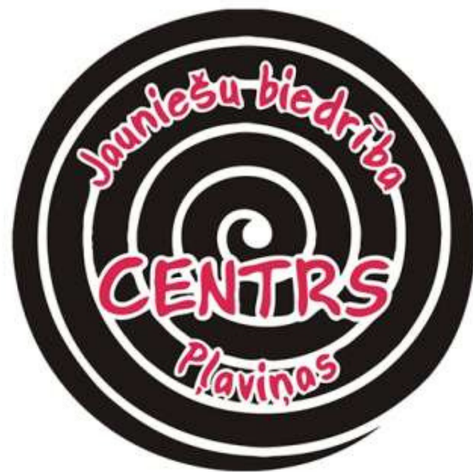
Pļaviņu "Jauniešu biedrība - CENTRS"